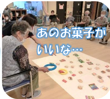
あのお菓子がいいな...