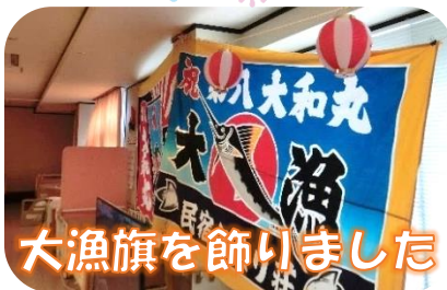
大漁旗を飾りました