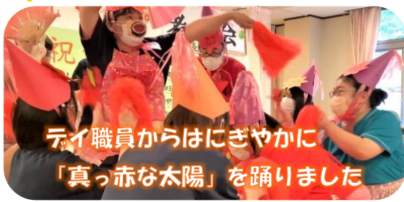
デイ職員からはにぎやかに「真っ赤な太陽」を踊りました