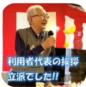
利用者代表の挨拶立派でした!!