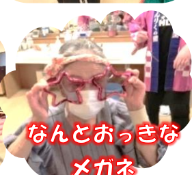
なんとおっきなメガネ