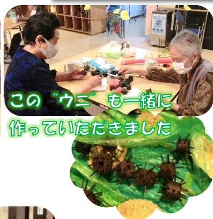
この「ウニ」も一緒に作っていただきました