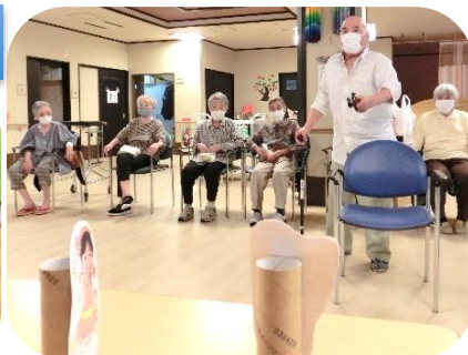
最後はさくら音頭を踊りました