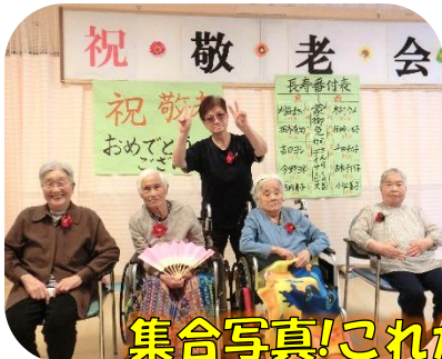
集合写真!これからもお元気で...